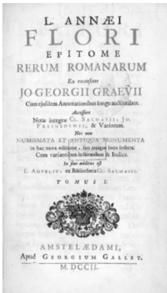
Lucius Annaeus Florus, Epitome rerum Romanarum , Amsterdam, Georges Gallet, 1702. K.U.Leuven, Centrale Bibliotheek, Tabularium, CaaA1280.