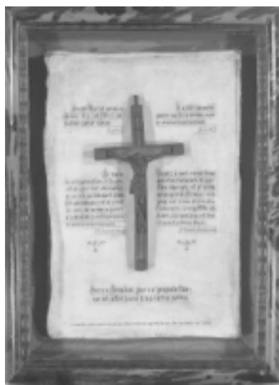
Devotiekastje (41 x 28 cm), ca. 1919, met het wapen van Leuven.