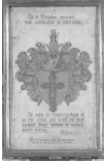
Devotiekastje (42 x 31 cm), ca. 1919, dat eertijds in de rectoriskamer hing.

1954), bij wie ze inwoonde, was ze nauw gelieerd met de universiteit, waarvoor ze talrijke diploma's en oorkonden vervaardigde.