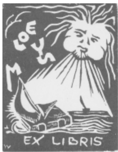
Ex-libris van Marcel Loeys.

Het zal niemand verwonderen dat het merendeel van de hoogleraren wier boekenbezit kon worden verworven, thuis te brengen is in de groep van de Humane wetenschappen. Wanneer uitzonderlijk een wetenschapper zoals de biochemicus René Lontie (1920-2000) zijn collectie nalaat, behoudt de Centrale Bibliotheek niet het materiaal dat zijn vakgebied betreft. Aanvaard wordt het resterende, waaruit Lontie's