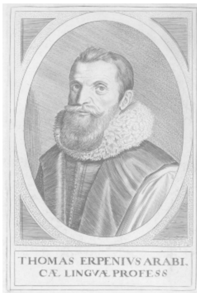
Portret van Thomas Erpenius.