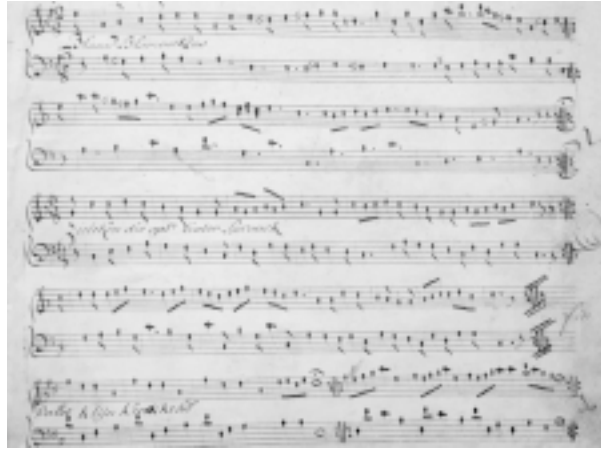
De eerste pagina van het beiaardhandschrift, met drie bewerkingen: Blauw blommekens , Zieleken die opt' tiater spronck , en Ballet Kleijn Krokkebil .

De helft van de 220 stukken draagt een titel. De meeste zijn Frans en verwijzen onder meer naar het operagenre uit die tijd: L'amour discret , Prenes garde à vous Lucile , La jolie muniere , Ariette du dormeur éveillé enz. Bij de Nederlandstalige titels zijn een aantal lokale liederen, zoals De brandt van Mechelen , De Antwerpse ommeganck , De Ostendische vaert , Prima Lovaniensis , Hanske van Loven , Medekensdansen van de meijboom van Brussel , en Wat vreught in 't Haegelandt . De andere stukken zijn meestal dansen, menuetten, marsen, gignes, contradansen en aanverwante. Het zuiver profaan karakter van de inhoud lijkt in tegenspraak met de hypothese dat het boek is geschreven voor de abdijbeiaard van Sint-Geertrui. Vergelijking met het beiaardboek uit 1785 van André Dupont, beiaardier van de abdij van Sint-Omaars, wijst echter uit dat de religieuzen van die tijd wel degelijk wereldlijke muziek binnen hun claustrum tolereerden. Van de 381 stukken in het boek van Dupont is er slechts één religieus, en een aantal zijn op zijn minst frivol te noemen, zoals Le plaisir des bains .