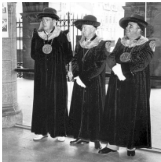
Togati. Geen professoren maar commandeurs van de confrerie van de Ridders van de Belgische Kaas bij de opening van de Schelpenboekententoonstelling.

Op 17 oktober 1986, 350 jaar na de oprichting van een Centrale Bibliotheek, werd de zaal ingewijd met een tentoonstelling waarin aspecten van de collecties werden getoond, onder de titel Uitgelezen. Een keuze uit het kostbare bezit van de Centrale Bibliotheek . Op 24 november opende er de eerste tentoonstelling met een catalogus, Erasmiana Lovaniensia , op bestelling van de academische overheid naar aanleiding van een beslissende bijeenkomst voor het Erasmus-programma. Leek het er het eerste jaar op dat het problematisch kon zijn ook iets te vinden om tentoon te stellen – Een kijk op bouwen (1987) is daar de vrucht van –, tien jaar later was ze al vóór het jaarbegin volledig volgeboekt. Naast eigen initiatief met eigen bezit, soms alleen met eigen mensen, soms in samenwerking