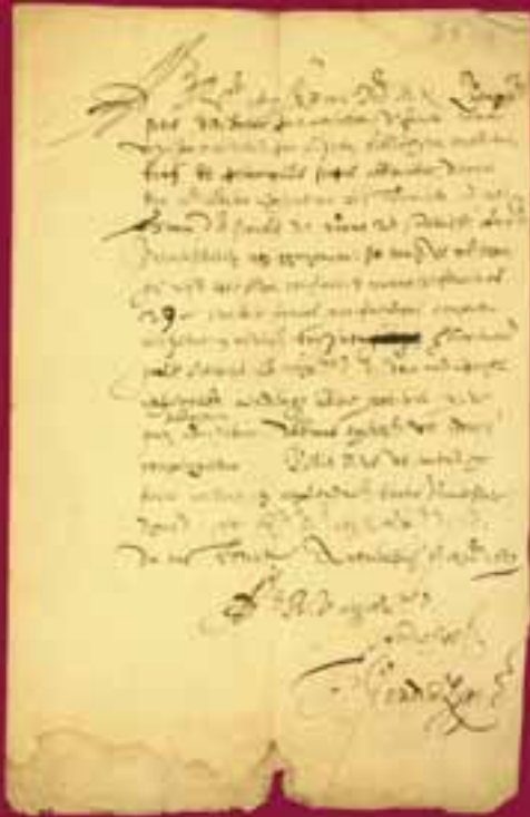
Brief van Franciscus Zypaeus, testamentuitvoerder van Laurens Beyerlinck, aan rector Cornelius Jansenius over de afwikkeling van het legaat Beyerlinck (8 nov. 1627).