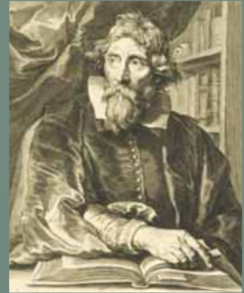
Erycius Puteanus (1574-1646), pleitbezorger voor de oprichting van een universiteitsbibliotheek, door Pieter de Jode naar Antoon van Dyck, ca. 1632.

Het Prentenkabinet in de Centrale Bibliotheek bezit een tienduizendtal portretgravures, waaronder die van vele professoren van de Leuvense universiteit. Ze zijn tot nog toe moeilijk toegankelijk. In een eerste fase zal elk portret beschreven worden in LIBISng. Daarna zullen de portretten gedigitaliseerd worden door een gespecialiseerd bedrijf. Daar hangt een prijskaartje aan ten bedrage van 30 000 euro. We rekenen op u om dit samen te kunnen realiseren.