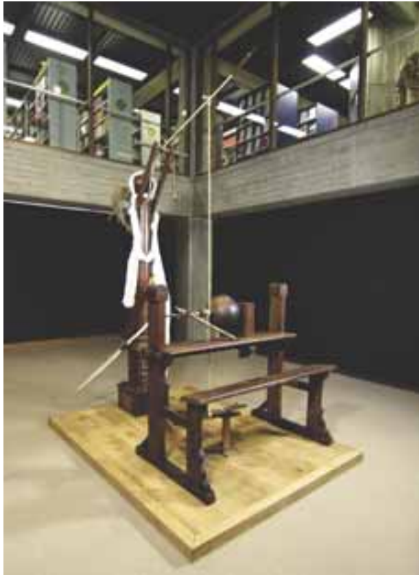
Hout in boeken, houten boeken en de 'fraaye konst van houtdraayen', Maurits Sabbebibliotheek, 2008.

Een gevarieerde tentoonstelling met handschriften en oude drukken, lezenaars, een heuse replica van een engeltjesdraaibank en een schamel, een guillocheerdraaibank, voorts ornamentdraaiwerk en een waaier van hedendaags houtdraaiwerk. Naar aanleiding van de tentoonstelling werd een lijvig boek met wetenschappelijke bijdragen gepubliceerd en werd een internationaal colloquium georganiseerd.