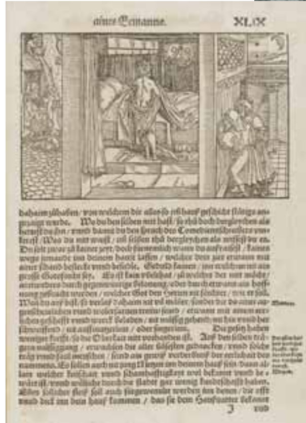
Juan Luis Vives, Von gebirlichen Thun und Lassen aines Ehemanns, Augsburg, 1544.

Een gevarieerde tentoonstelling met handschriften en oude drukken, lezenaars, een heuse replica van een engeltjesdraaibank en een schamel, een guillocheerdraaibank, voorts ornamentdraaiwerk en een waaier van hedendaags houtdraaiwerk. Naar aanleiding van de tentoonstelling werd een lijvig boek met wetenschappelijke bijdragen gepubliceerd en werd een internationaal colloquium georganiseerd.