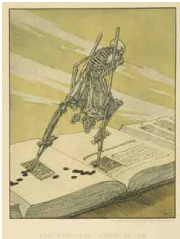
Joseph Sattler, Danse macabre moderne , Berlijn-Parijs, 1894.

De universiteitsbibliotheek werd na twee branden en een splitsing er telkens weer bovenop geholpen door vele gulle schenkers. Nog steeds wordt de collectie verrijkt door schenkingen en legaten. Ook een occasionele schenking van een waardevol boek wordt graag aanvaard. Wenst u een deel van uw nalatenschap aan het Bibliotheekfonds over te maken, dan doet u dat onder de vorm van een legaat. Dat kan zowel een geldsom omvatten als een waardevolle collectie.