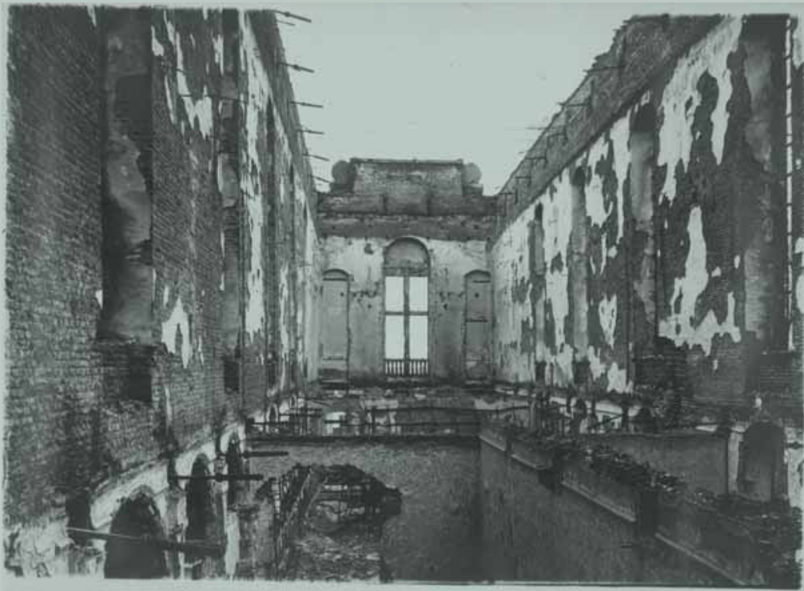
De uitgebrande universiteitsbibliotheek aan de Oude Markt, ca. 1915.